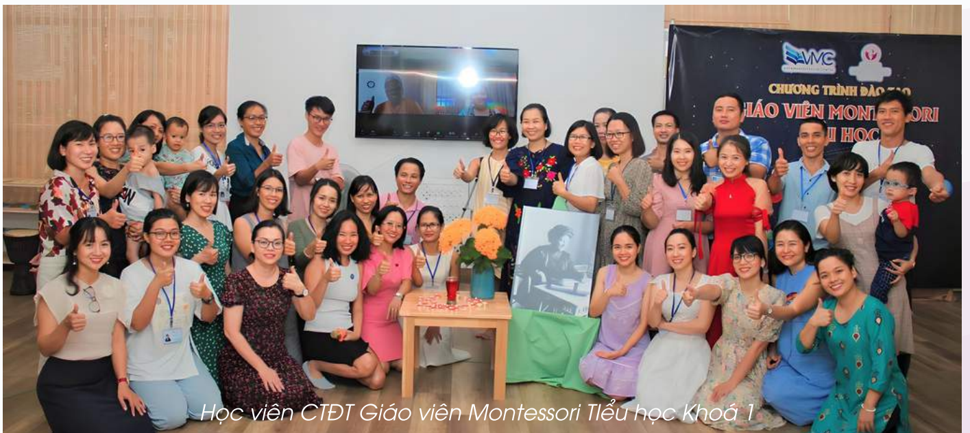
Học viên CTĐT Giáo viên Montessori Tiểu học Khóa 1

Thực hành với học cụ, với sự giám sát và hướng dẫn của giáo viên được đào tạo sẽ giúp cho học viên rèn luyện kỹ năng giảng dạy, làm rõ kiến thức của phương pháp để ứng dụng trong công việc.