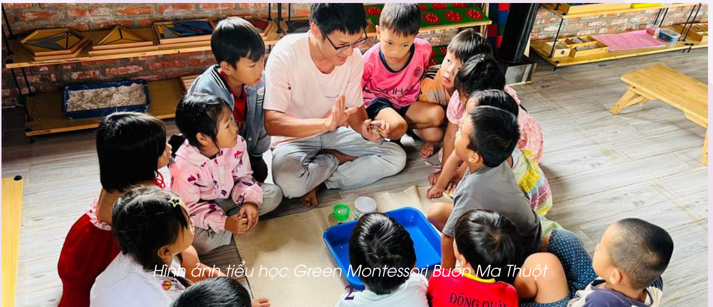
Hình ảnh tiểu học Green Montessori Bùn Ma Thuật